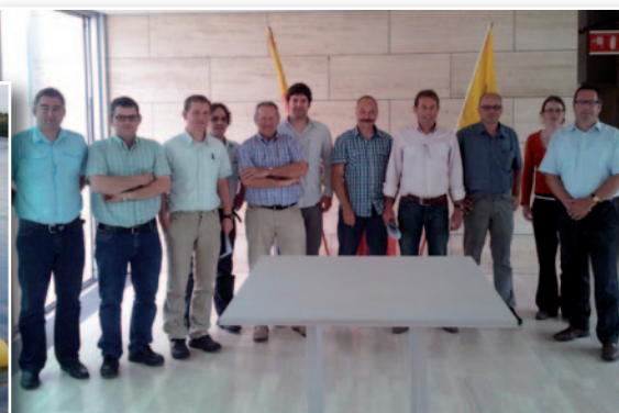
... en op bezoek in het Huis van de Stad.