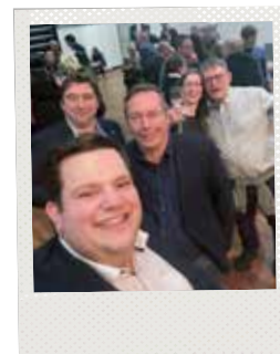
▲ N-VA Lommel op de nieuwjaarsreceptie van de stad.