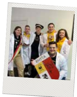
▲ Jong N-VA ontsnapt uit de escaperoom.