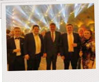
▲ Jong N-VA met Jan Jambon.